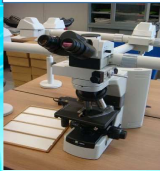
計測に用いる顕微鏡