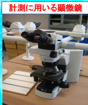
計測に用いる顕微鏡